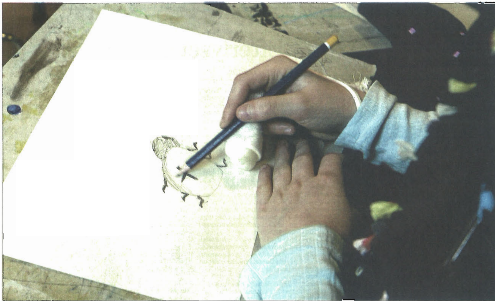
Skoleeleverne tegnede løs under koncerten Roskilde Bibliotek.

Handlingen lyder, som følger: En sommerfugl møder edderkoppebedstemoderen. Sommerfuglen bliver ikke spist - det bliver til gengæld en spyflue med store sorte solbriller. I blomsterfluerens land, hvor alle kommer til slut - også spyfluen - danser sommerfuglen og edderkoppebedstemoderens ånd i et svæv.