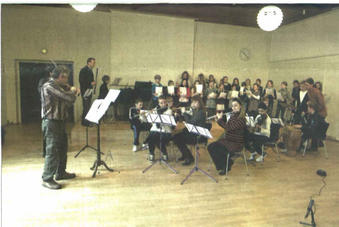
Letmark Kvartetten stod for den musikalske del af underholdningen sammen med Lynghøjskolens kor og elever fra Roskilde- og Hvidovres Musikskoler.

Eleverne fra Lynghøjskolen fik først spillet instrumenterne for de enkelte insekter, så de kunne danne