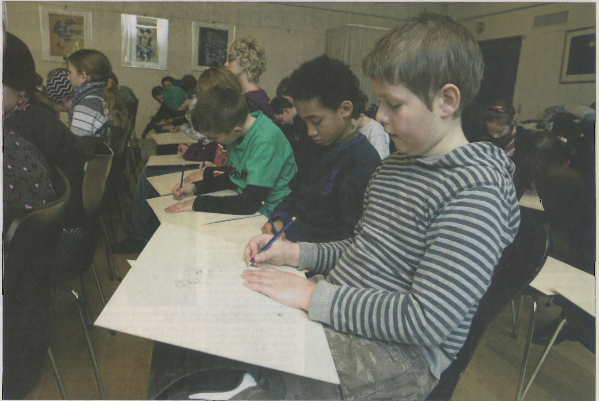
Der var fuld koncentration hos samtlige elever fra Lynghøjsskolen i Svogerslev, da de skulle forsøge at tegne den musik, de hørte ved koncerten i salen på Roskilde Bibliotek.